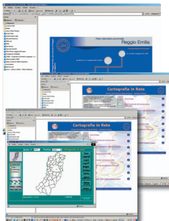
▲ http://www.piano telematico.it

Accade allora che l'e-government possa rilevarsi incapace di portare innovazione diventando non solo inutile, ma dannoso, in quanto finisce con il rappresentare un ulteriore "adempimento", un onere aggiuntivo a carico degli Enti senza che vi sia alcuna motivazione a tenerlo in vita.